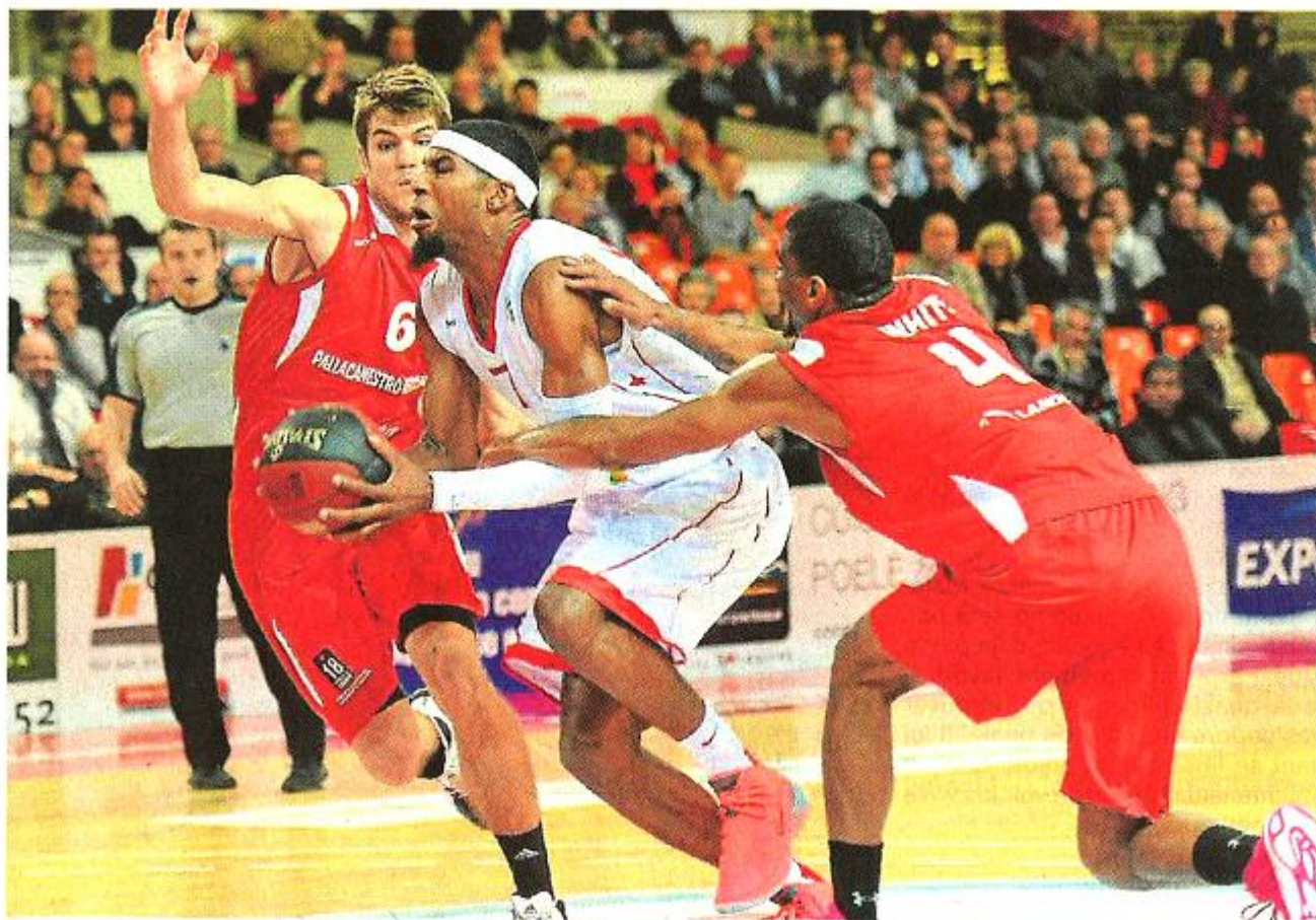
Au match aller, les Choletais s'étaient montrés brillants face à une belle équipe de Reggio Emilia.