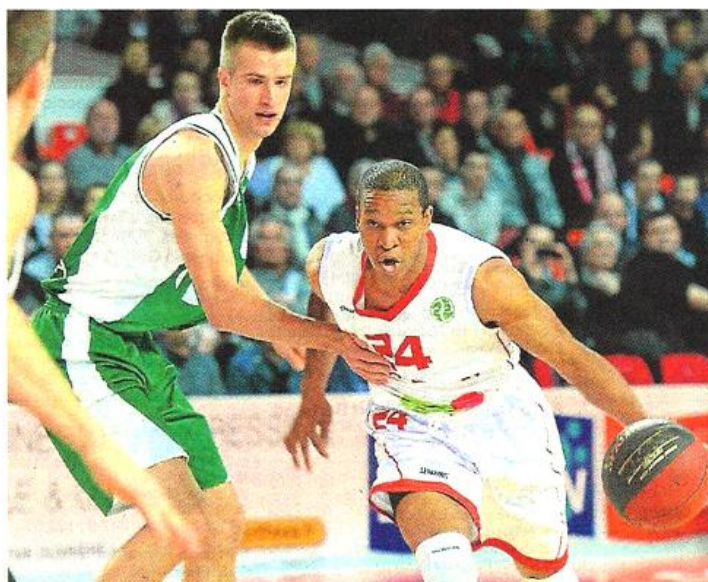
Thomas et ses coéquipiers n'ont plus rien à espérer de cet Eurochallenge.

Plus dans le rythme, ils livraient par contre un deuxième acte intéressant. Le retour de Thomas sur le parquet s'avérait payant, puisque le meneur américain inscrivait deux tirs primés qui permettait à CB de recoller au score, tandis que les Italiens manquaient cinq trois points consécutifs (22-20, 14'). Autre entrée