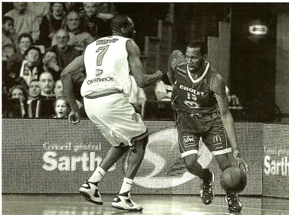
Si Ho You Fat prend ici le meilleur sur Koffi, ce sont bien les Manceaux qui ont dominé Cholet, hier.

Les Sarthois croyaient-ils avoir fait le plus dur ? L'hypothèse tient la route car dans