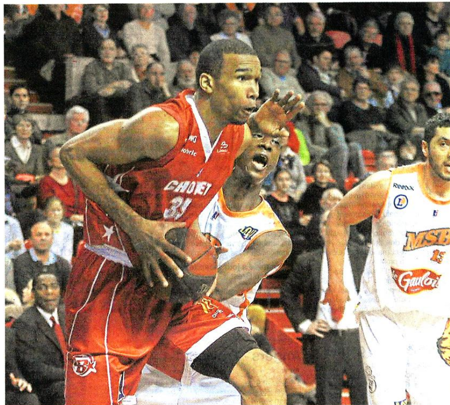
Battu au Mans (83-72), Cholet a bien résisté et trouvé des motifs d'espérance.