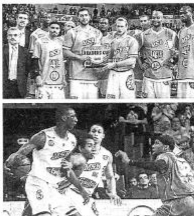
Après avoir présenté le trophée de la Leaders Cup à leurs fans, les Manceaux ont dominé sur la durée leurs voisins choletais pour rester bien calés dans le wagon de tête.

JP Batista sera remis sur pied mercredi pour le 1/4 de finale de Coupe de France ?