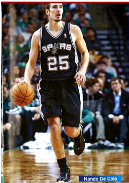
Nando De Colo

de la blessure de Nikola Pekovic, tournant à près de 8 rebonds et 3 contres de moyenne sur la période. "Il nous donne beaucoup d'énergie", confirme la star Kevin Love au Minneapolis Star Tribune. "Il ne va pas avoir la production de Pekovic offensivement mais défensivement il est excellent." A 30 ans le pivot des Bleus semble parfaitement maîtriser les aléas d'une saison NBA : "J'ai été titulaire pas mal de fois et dans de nombreuses circonstances. Je suis habitué à assumer quand un joueur se blesse. Il faut rester soi-même dans ces cas-là." Une blessure au genou fin février l'a cependant coupé dans son élan.