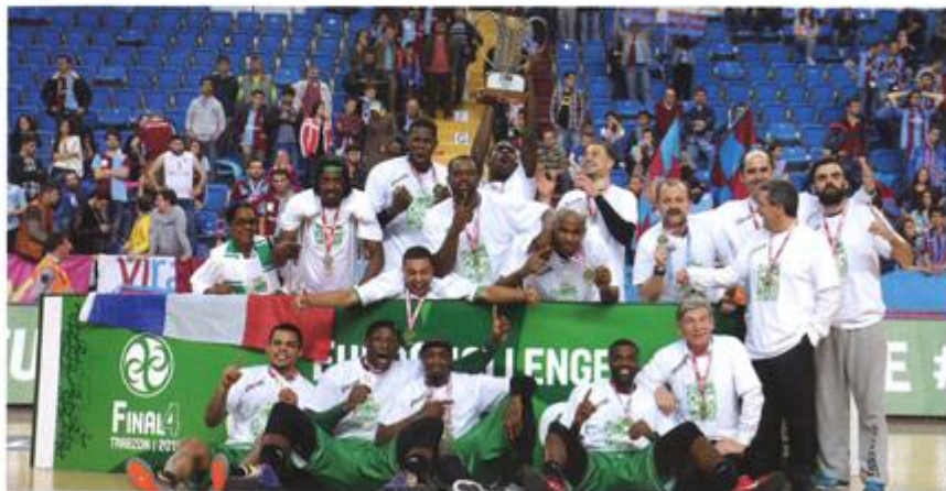
➤ Nanterre vainqueur de l'EuroChallenge en 2015 jouera l'Eurocup cette saison.

➤ Les clubs de Pro B ne possédant pas d'un centre de formation agréé ont l'obligation d'aligner quatre joueurs « formés localement » de 23 ans et moins, sauf à verser une indemnité compensatoire à la LNB. ●