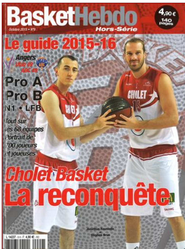
Basket Hebdo n°9 – Hors Série – Octobre 2015