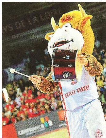
La mascotte Charalito donne le rythme.

Les supporters croisaient les doigts pour ne pas revivre le scénario catastrophe de deux matchs perdus à domicile. Leur club s'incline de trois points face à Limoges. Lire aussi en pages Sports.