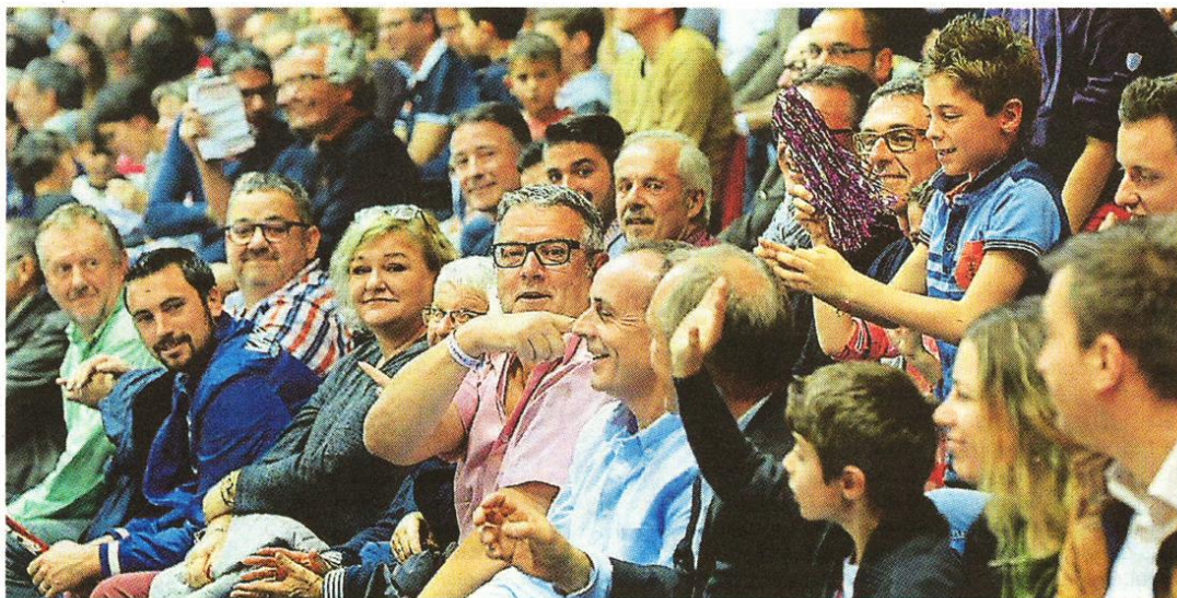
4 200 spectateurs sont venus supporter Cholet Basket, hier soir, dans la salle de la Meilleraie. Hélas, une courte défaite au coup de sifflet final.