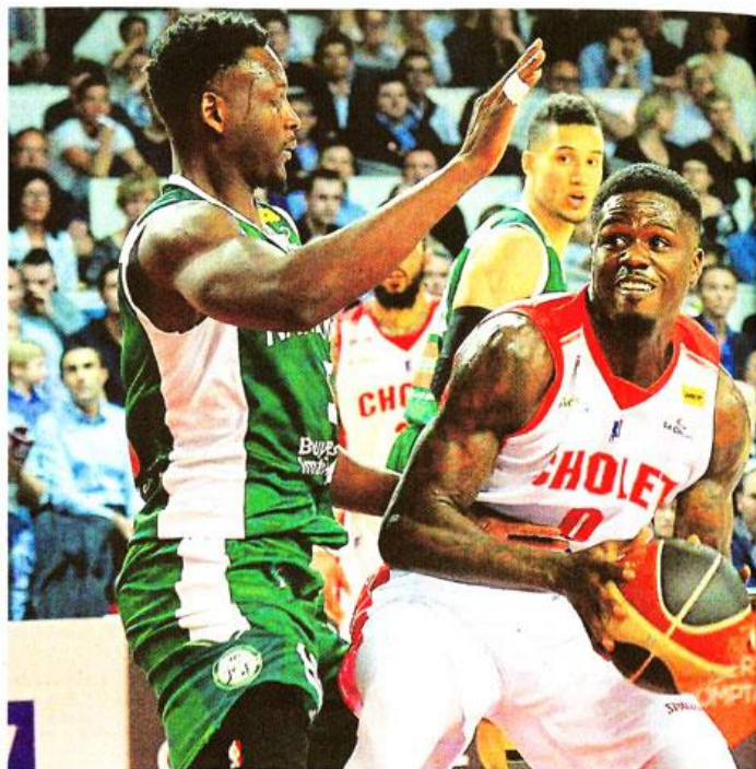
MJ Rhett et les Choletais, transfigurés, n'ont laissé aucune chance aux Parisiens.