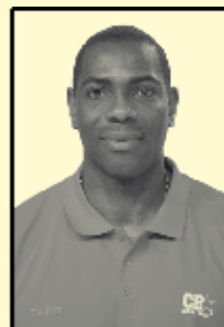
Jim BILBA Entraîneur Assistant 41 ans Français