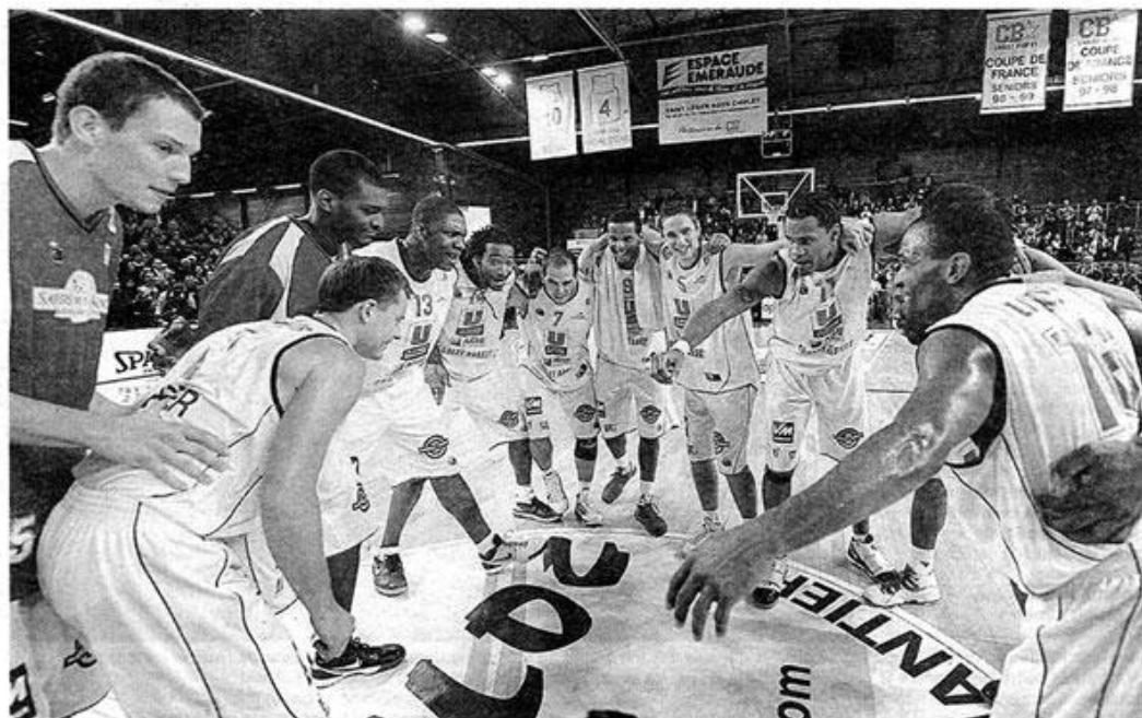
Les Choletais peuvent être satisfaits : ils demeurent invaincus, trônent sur la Pro A et viennent d'officialiser leurs très grosses ambitions en faisant mordre la poussière à l'Eurologueur orléanais.