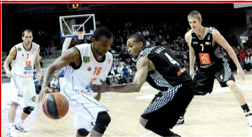
Sam. 17 oct. : Cholet basket (CB) a su disposer de l'équipe d'Orléans et prend ainsi la tête de la Pro A. De leur côté, les Espoirs de CB sont aussi premiers. Une belle série de 3 victoires en 3 rencontres à poursuivre...

La Dépêche du Midi – Lundi 19 octobre 2009