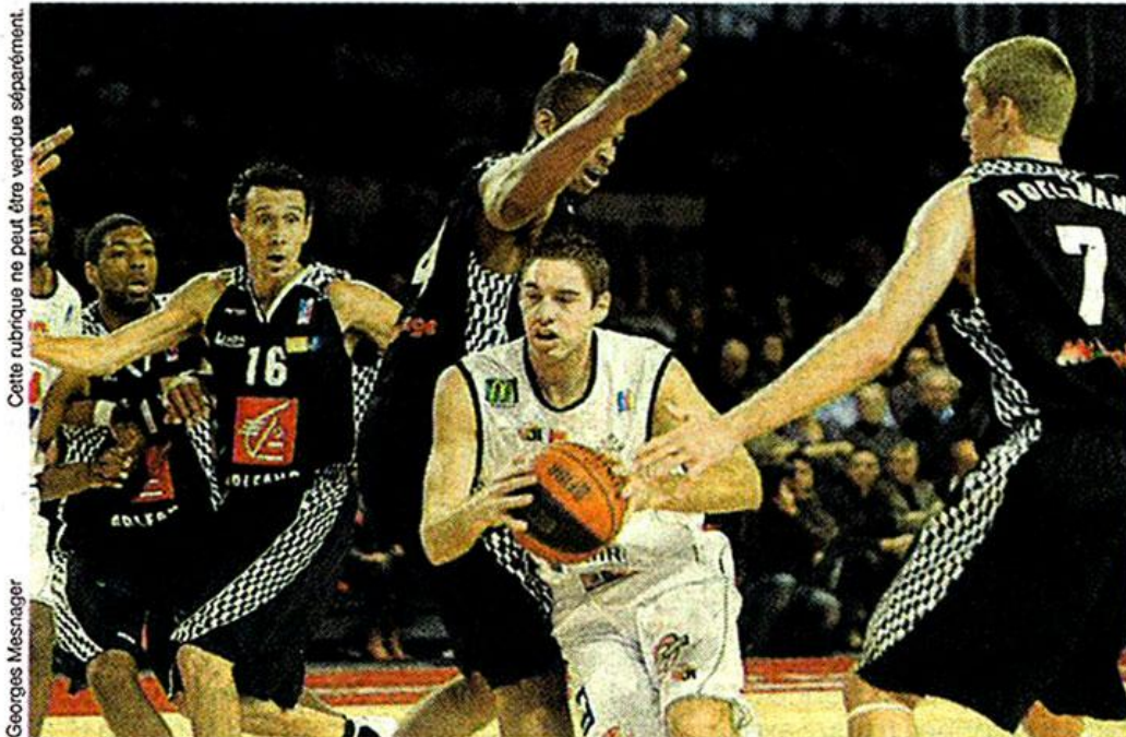
Cette rubrique ne peut être vendue séparément.