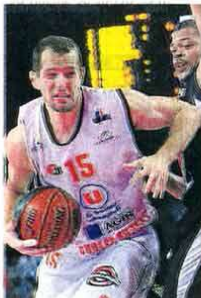
Le public choletais a découvert Avdalovic.

Intense. Très intense. Sur le parquet, Choletais et Orléanais se livrent une bataille digne d'un vrai match à enjeu. Dans ce contexte, DeMarcus Nelson soigne sa feuille de statistiques (4 points, 3 rebonds) tandis que les intérieurs, de Duport à Moss en passant par Falker, se font une raison. L'accès aux paniers est plus qu'ardu !