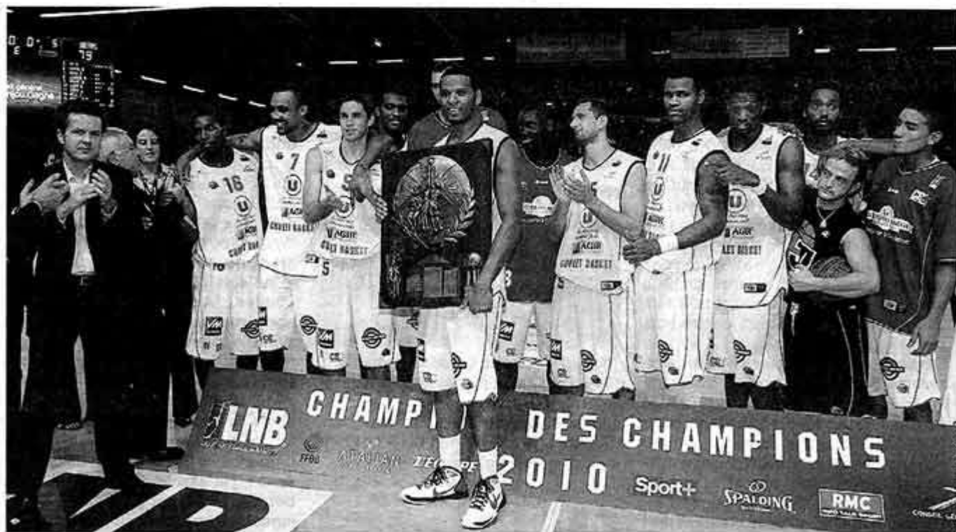
Il a fallu attendre les prolongations pour que les Choletais soient sacrés « Champion des champions » 2010.

La marque : Sy 15, Moss 7, Ndoye 5, Curti 20, Reynolds 16 puis Hervé 2, Lebrun, Smith 6, Bell, Moerman 8.