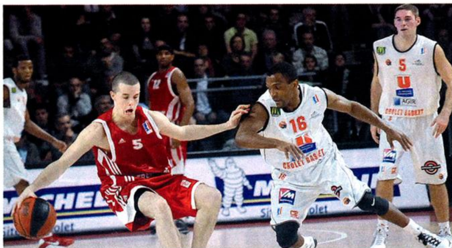
Sam. 14 nov. : nouvelle victoire de Cholet Basket (CB) face à Strasbourg, devant près de 4 400 Choletais, ainsi que les élus des communes de la CAC, venus encourager l'équipe phare de ce début de championnat de France Pro A où CB demeure en tête.

Synergences Hebdo N°171 - Vendredi 20 novembre 2009