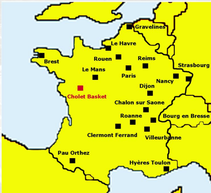
CHAMPIONNAT PROA – 18 CLUBS