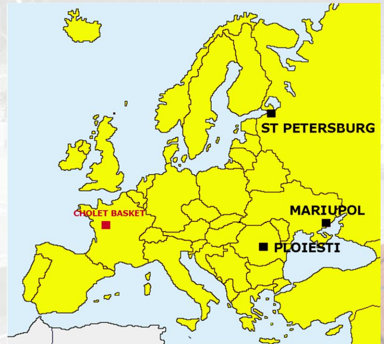
FIBA CUP – 4 CLUBS