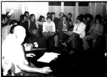
18 juin 1975 – Naissance de Cholet Basket