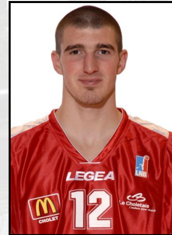
Nando DE COLO