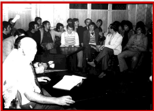
18 juin 1975 – Naissance de Cholet Basket