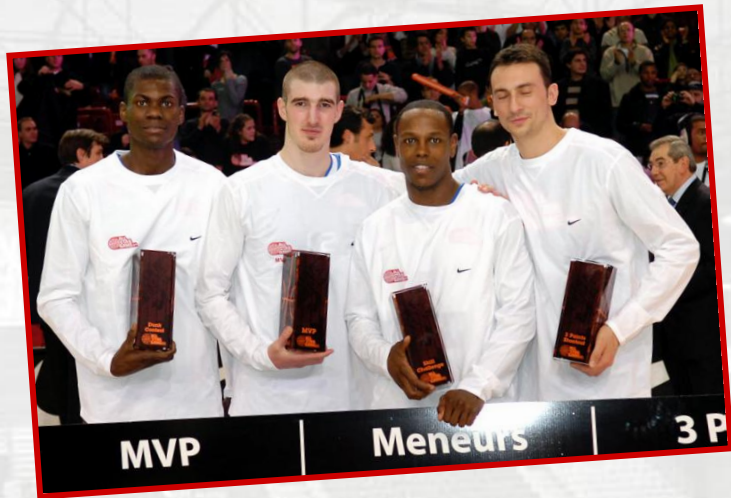
MVP All Star Game