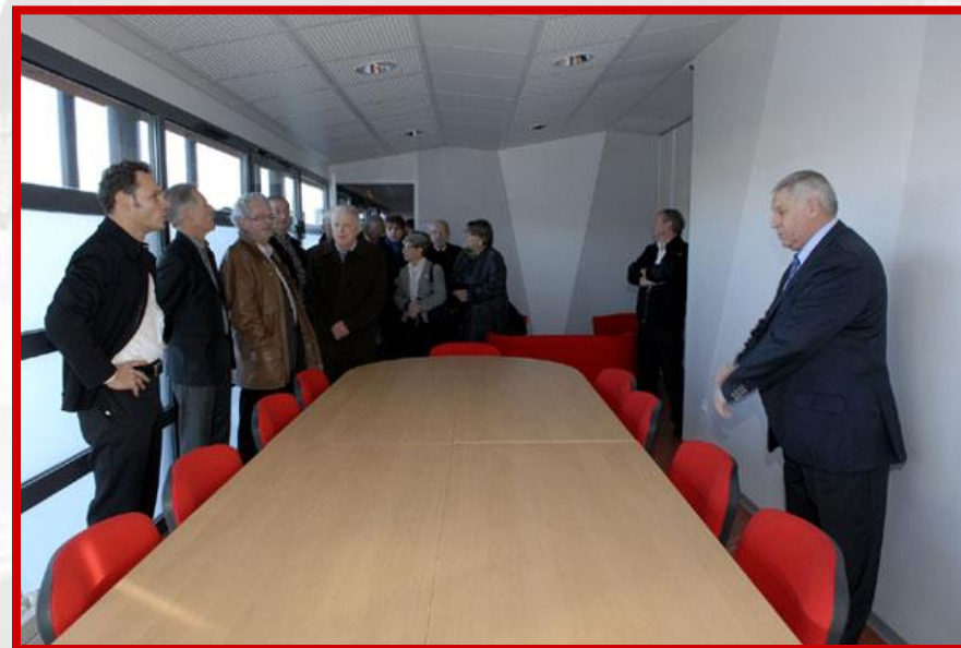
La salle de réunion du centre d'hébergement