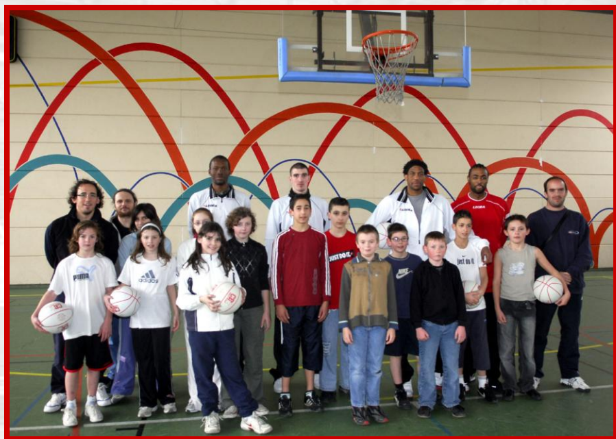
Tournoi des quartiers 2007/2008