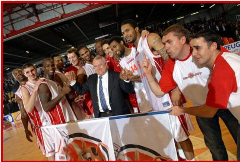
CB-AEK ATHENES – 27 novembre 2007