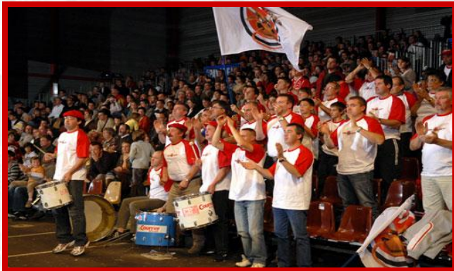
Le club des supporters Les C'Bulls