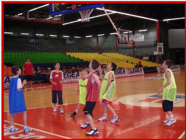
Entraînement dans la salle des pros