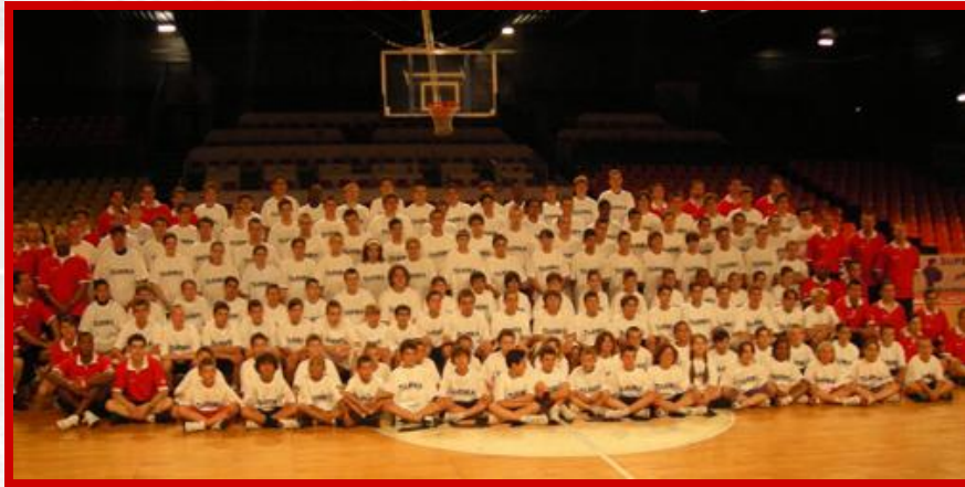
Un des groupes des Camps d'Été 2007