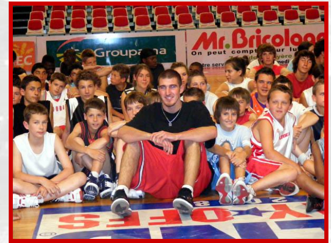
Rencontre avec des joueurs pros