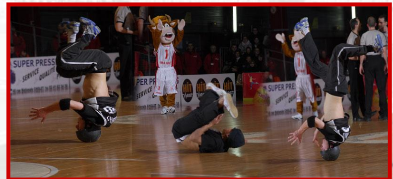
Les danseurs de Hip Hop