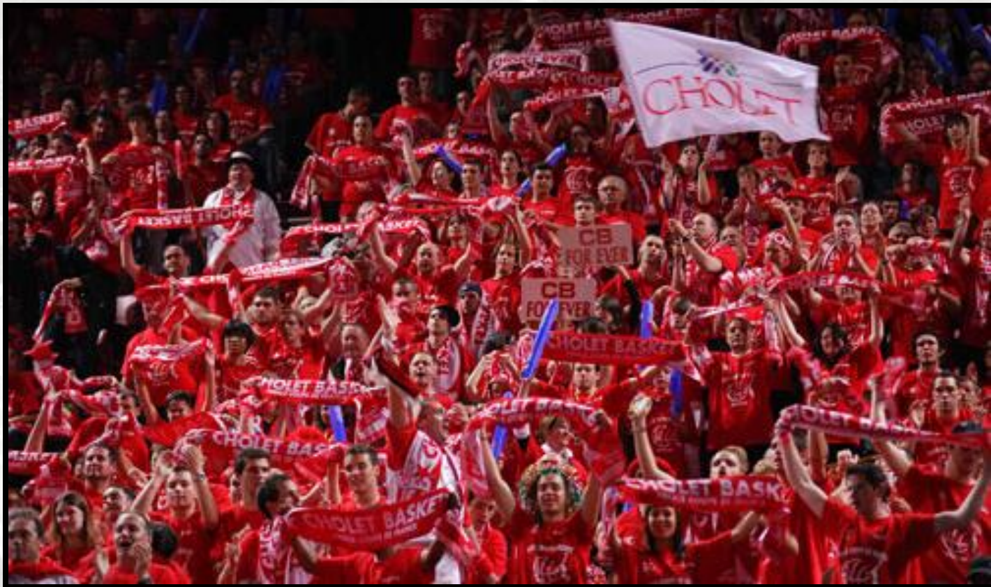
Palais Omnisport de Paris Bercy – 18 mai 2008