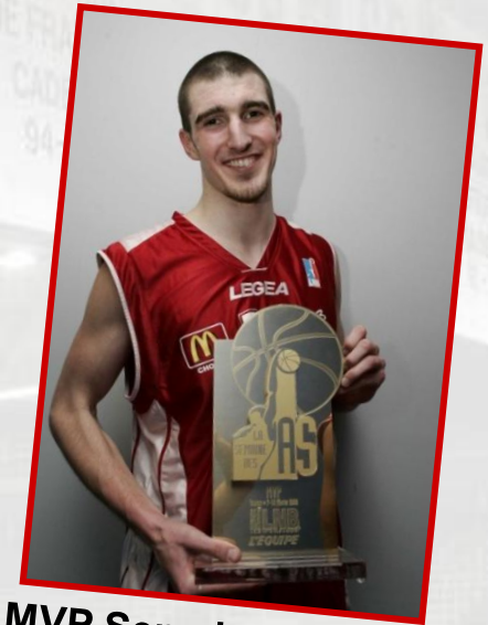
MVP Semaine des AS