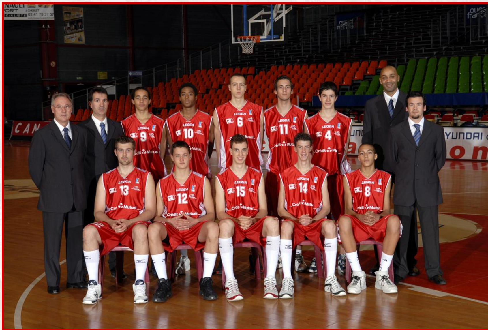
Saison 07/08 Champion de France Cadets 1ère Division Groupe B