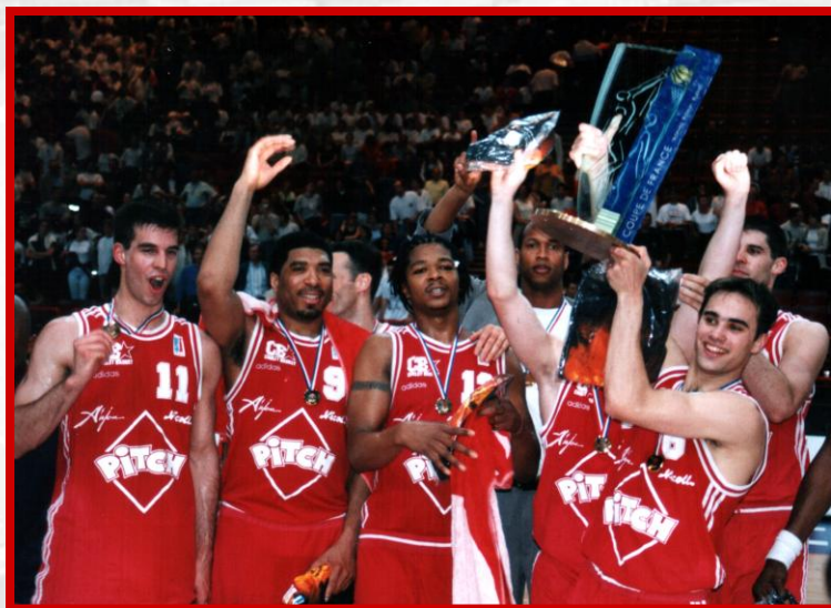
1999 : CB remporte la Coupe de France à Bercy