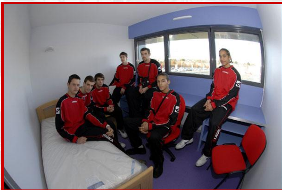
Les jeunes du centre de formation