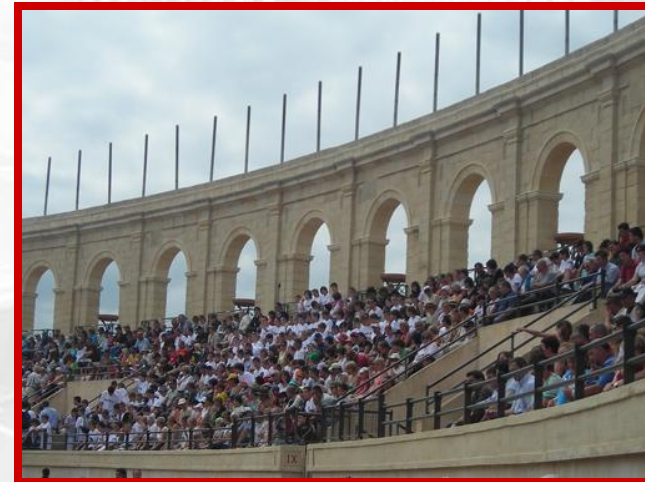
Visite du Grand Parc du Puy du Fou