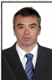
Directeur : CHEVRIER