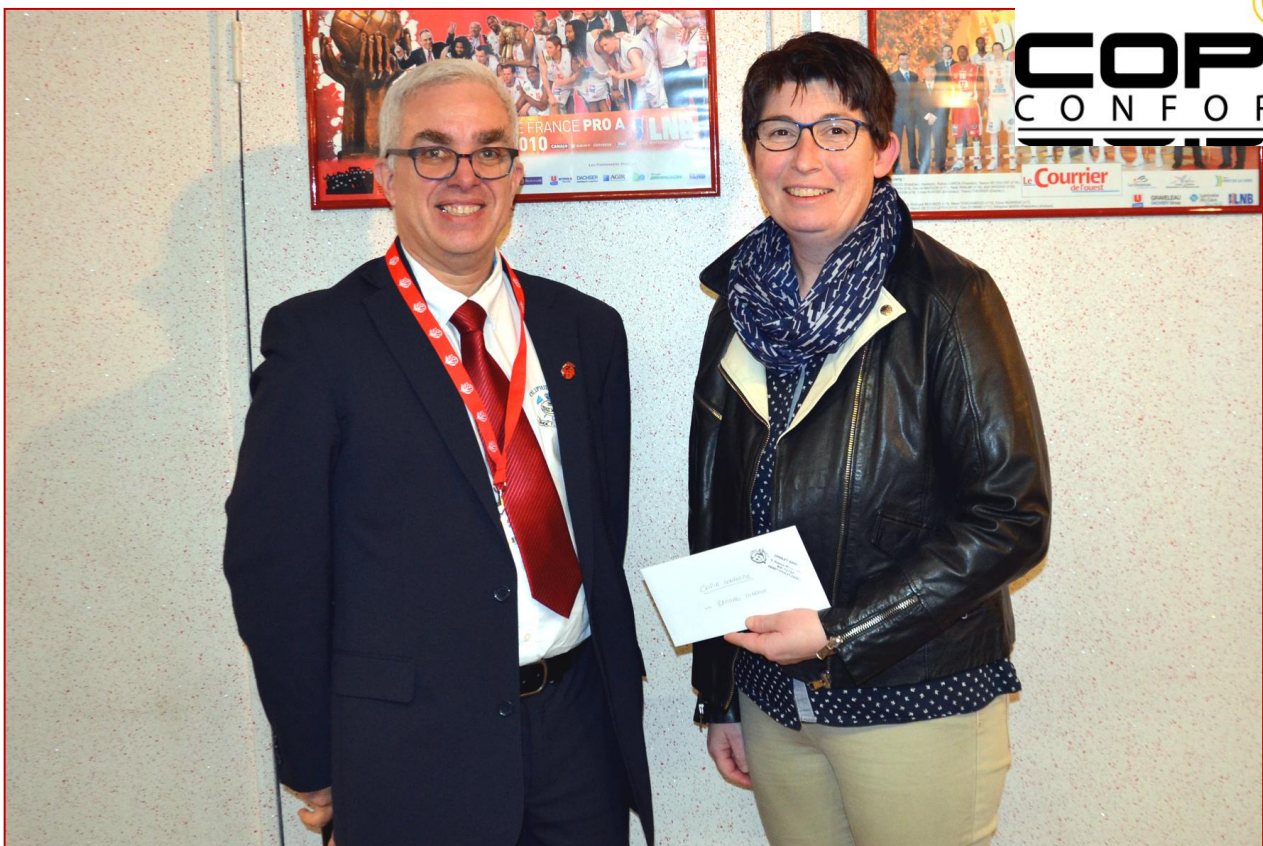
La société BATIMPRO CHARRIER (excusée), remporte 100 cartes de visite + 2 agrandissements 40 x 60 cm offerts par COPIE CONFORME , représentée par Mme Murielle HAMARD .