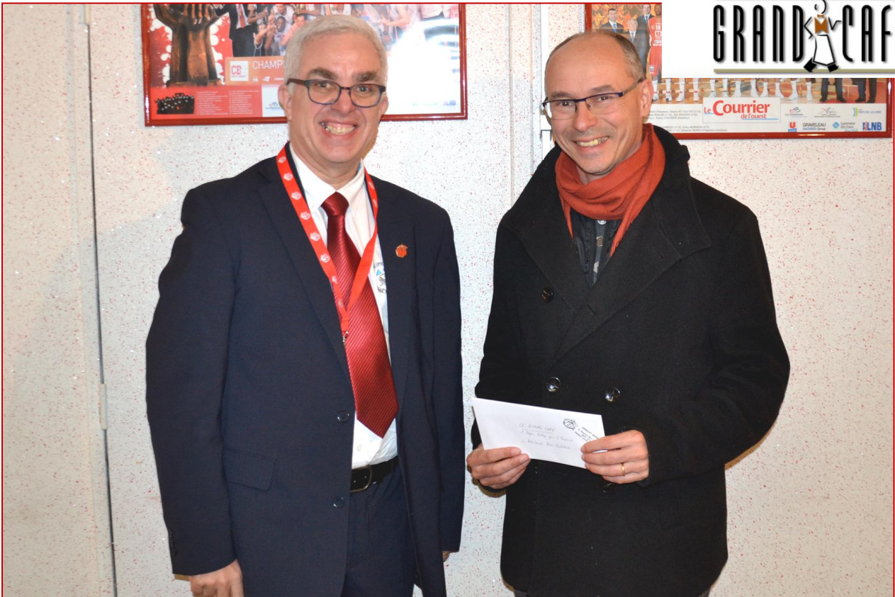
Les AMBULANCES SÈVRE CHOLETAISES gagnent un repas prestige pour 2 personnes offert par LE RESTAURANT LE GRAND CAFE (excusé).