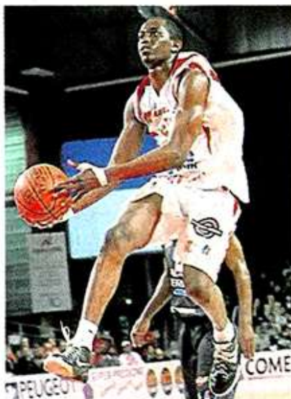
Rodrigue Beaubois dans ses œuvres.