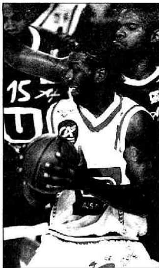
Marquis a été le meilleur Choletais hier soir à Strasbourg