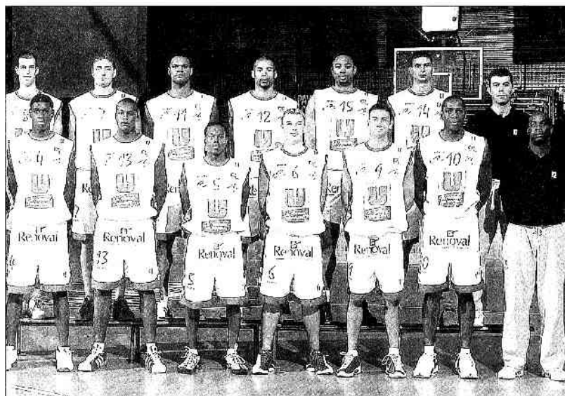
Le Cholet-basket vendredi 2004-2005 entre ce soir dans le top de la Pro A sur le terrain de la remarquable arène de Strasbourg.

L'entraîneur choletais a du travail à faire. Mais ce soir (20h) au Palais des Sports de Strasbourg