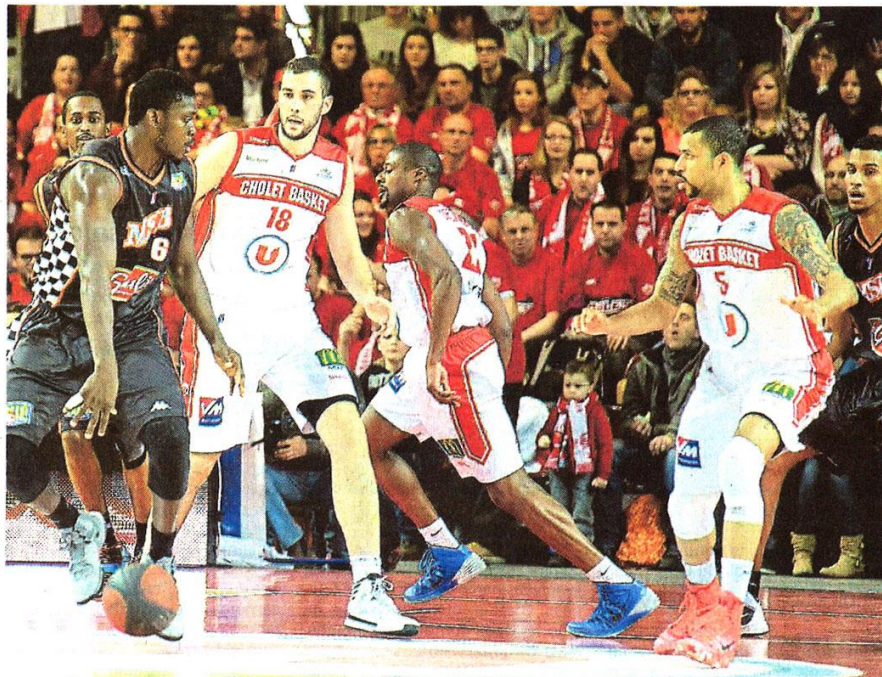
La rencontre de janvier 2015, pendant laquelle les Choletais s'étaient inclinés face aux Manceaux.