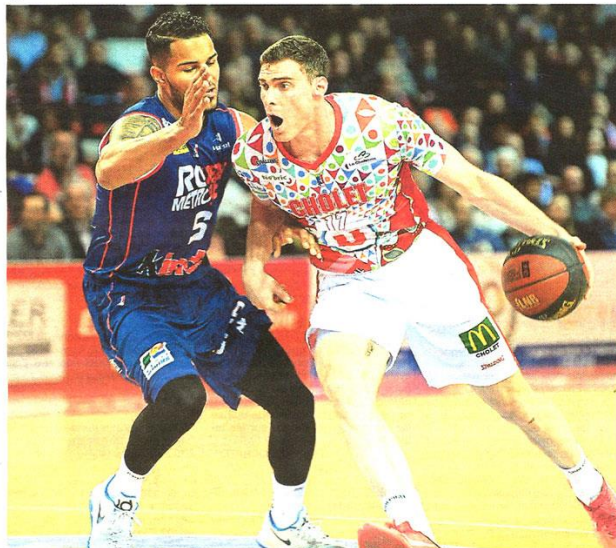
Cholet s'incline face à des Rouennais déjà assurés d'évoluer en Pro B la saison prochaine.