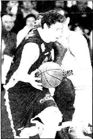
Bardet qui coche Ball a marqué seulement trois points, hier soir