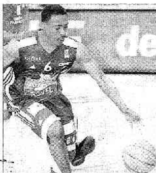
Longtemps menés par Le Havre, Lyday et Villeurbanne ont pris le dessus en fin de match.

Dijon - Clermont 81-53 (24-17, 15-11, 17-2, 28-13). DIJON : Monnet (8), Ndong (12), Barrett (22), Hill (13), Sanikidze (4), Mancio (7), Nicoud (12), Stelanski (4), Demmevo (1). CLERMONT : Issa (2), Melody (8), Racine (3), Gosa (16), Darrigand (3), Whearty (6), Mbengue (17).