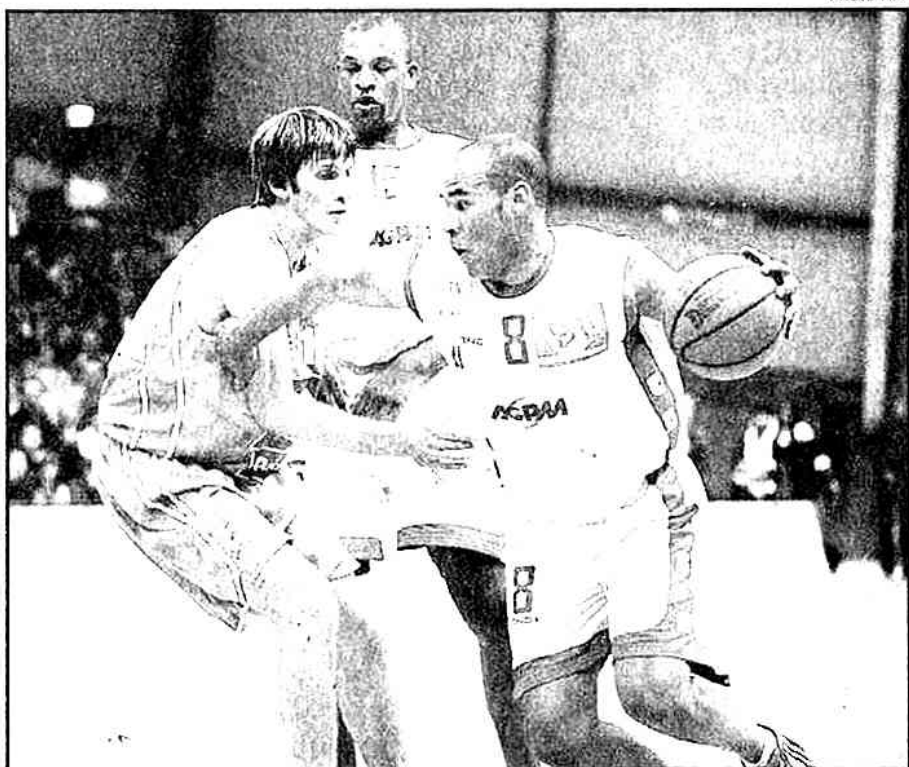
Hyères-Toulon a dominé facilement Pau-Orthez

Vichy s'enfonce définitivement L'autre surprise a été l'oeuvre