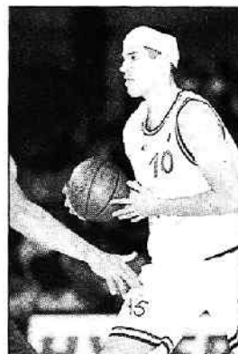
Dubos et Cholet-Basket retrouvaient Châlons-en-Champagne, hier soir.

La victoire venait de choisir son camp. Un panier facile manqué et une attaque dépassant les trente secondes coûtaient cher à Georget et Cie. Malgré tous leurs efforts, ils ne réussissaient pas à se rapprocher de leurs invités à moins de quatre longueurs (60-64, 37 e ). Cholet déroulait, lors des dernières minutes, offrant une démonstration intelligente et imparable de passe à dix. L'Espé perdait ses derniers espoirs et ses ultimes illusions à un peu moins de deux minutes du bu-