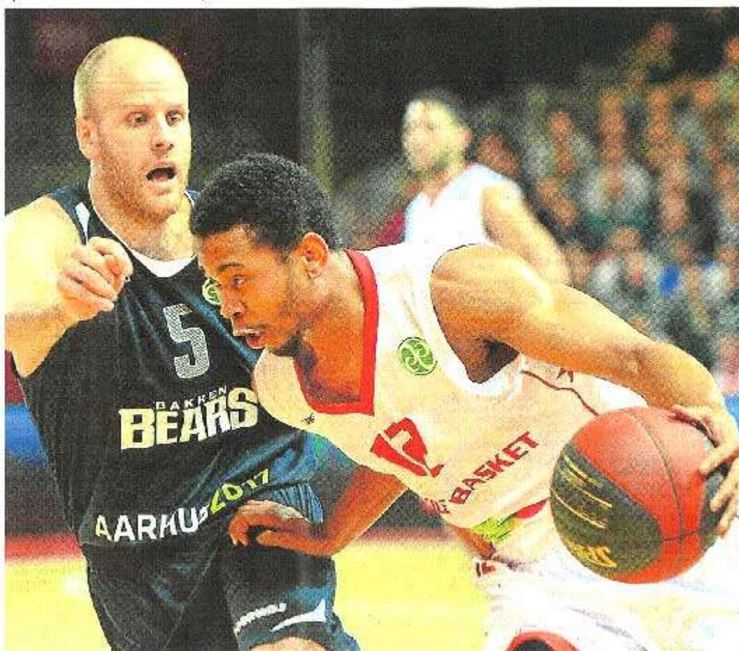
Stoglin, auteur de 17 points, et les Choletais n'ont pas été inquiétés, hier.

BAKKEN BEARS. Paterson 6, Jakobson 7, Barakoh, Fawn, Janka 14, Barker 17, Ivarsen 3, Qvist 1, Lindberg, Sahlerz, Christoffersen 9, Pann 16. Entraîneur : Ville Tuomari.