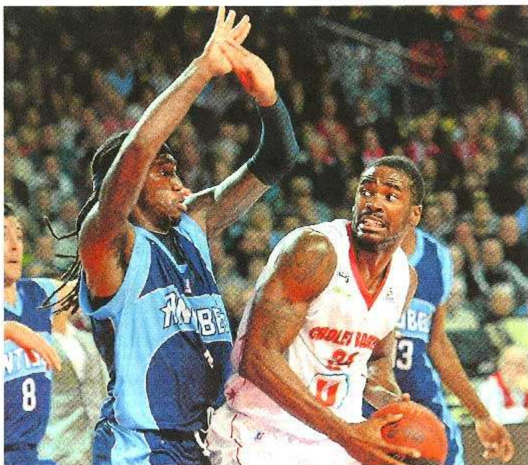
Burrell et les Choletais ont l'occasion de terminer leaders du groupe G, en cas de victoire ce soir.

Trois joueurs de Gravelines suspendus. La LNB a annoncé hier la suspension provisoire, jusqu'à la commission de discipline du 26 décembre, de Bokolo, Akpomedah et Diawara. La décision fait suite à la bagarre survenue durant la rencontre Paris-Levallois-Gravelines. Les trois joueurs ne participent donc pas au match Cholet-Gravelines, programmé le 23 décembre.