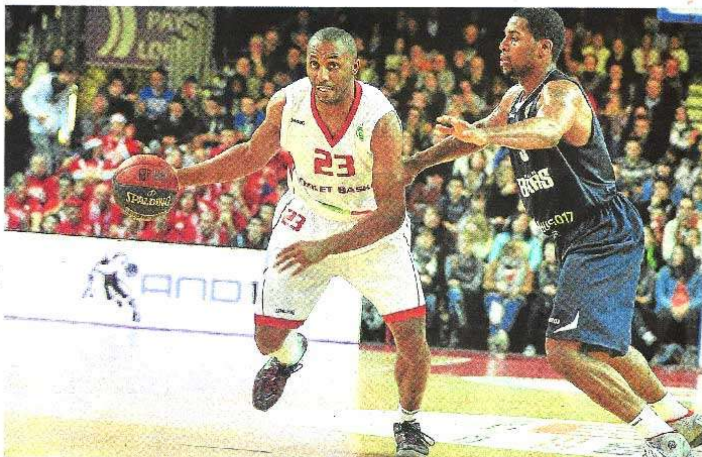
Choiet, La Meilleraie, hier. Avec un Chatfield des plus inspirés à la baguette, les Choletais ont écrit une partition aboutie.

Après le pire, samedi dernier contre Antibes, les Choletais ont offert le meilleur à leur public, hier soir, face aux Danois des Bakken Bears d'Aarhus. Pour le coup, on en redemande.