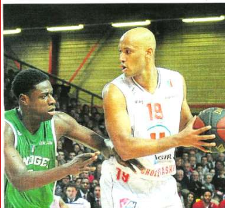
Vainqueurs de Limoges, les Choletais sont enfin parvenus à envoyer leur mauvais spirale.