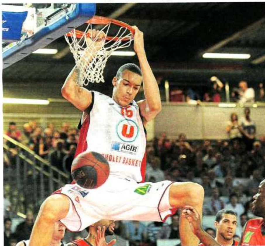
Cholet s'est imposé hier soir face à Chalon (101-97). La 6 e place est encore possible.