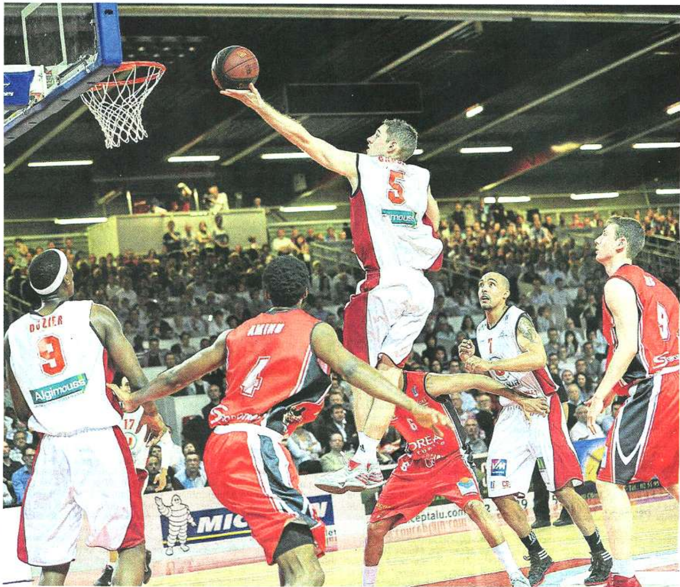
Cholet, la Meillerie, hier soir. A l'image de Causeur, CB s'est montré à la hauteur du défi proposé par les Chalonnais. De bon augure avant les play-offs.