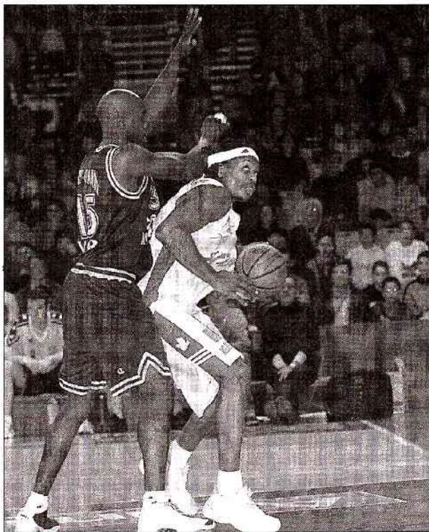
Wesson - Miller : le duel vaudra encore le détour sous les panneaux de la Meilleraie.

« Il y a toujours une certaine part d'incertitude lors d'une reprise, et des automatismes qu'il faut très vite retrouver, explique l'entraîneur Maugeois. Ceci dit, il est clair que l'on aborde Hyères-Toulon avec un gros désir de bien faire et de s'investir pleinement en défense, à l'image de notre dernière rencontre à Vichy (victoire 75-90). De toute façon, devant une formation aussi équilibrée en attaque que celle-ci, nous n'avons aucune autre option possible. »