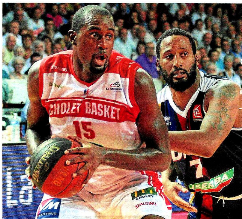
Pour l'ouverture de sa saison à La Meillerie, Cholet sort vainqueur de son match face à Dijon. page 2

Ouest France – Dimanche 28 septembre 2014