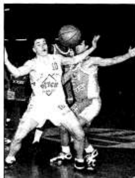
Le Choletais Marcaccini

« Levallois est bien plus fort aujourd'hui, c'est indiscutable », analyse Eric Girard. « Il n'y a plus qu'un seul étranger, c'est vrai, mais Deines, Gaither et naturellement Register c'est le label USA. Et puis Sonko, présent dans tous les compartiments du jeu — shoots, passes, rebonds — pèse autant sur sa formation qu'un Américain. C'est très fort à l'extérieur, et pour peu que l'on s'abaisse un Sonko autour de 30 points, avec un Zig ou un Gaither qui nous en passe 20... la soirée pourrait s'annoncer délicate. Gagner sera donc déjà de tenir le coup en défense. » Avant de prendre en