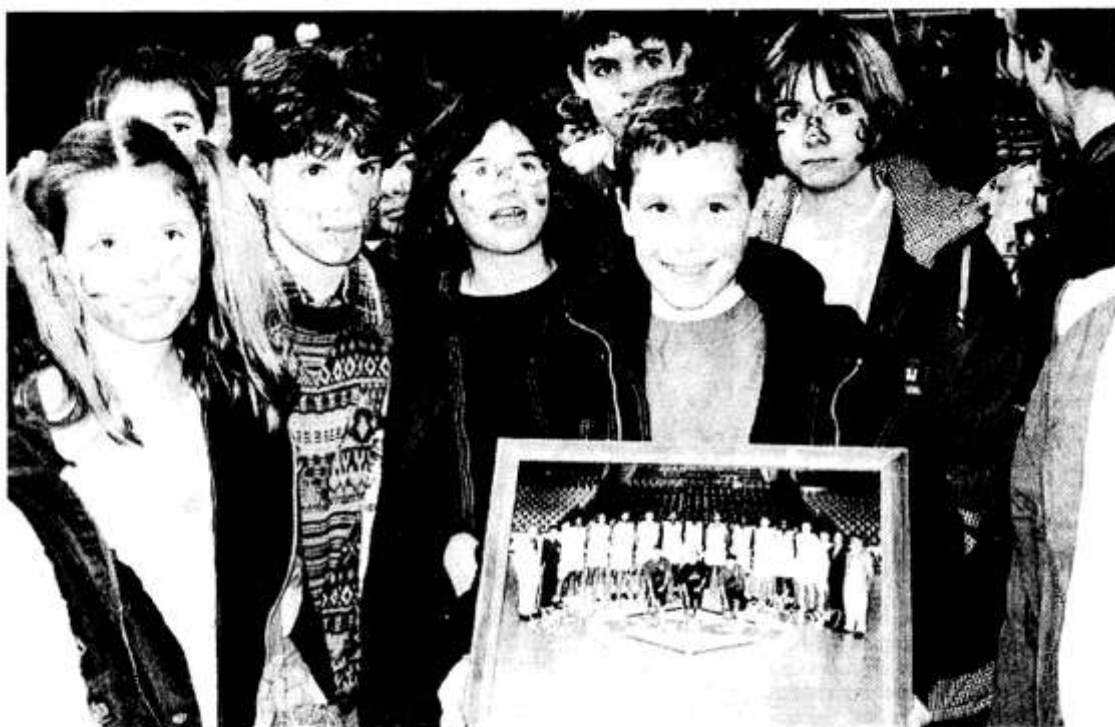
Tout fiers les jeunes de Thouars, avec un poster dédié de l'équipe de Cholet Basket.