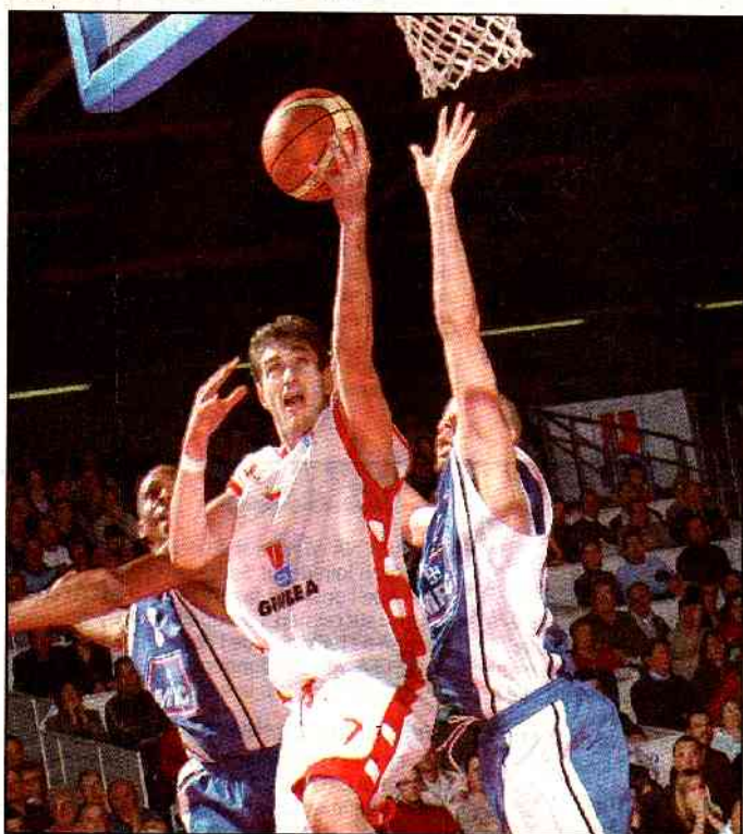
Hier, seuls Olivier Bardet (phot) et Cyril Akpomedah ont marqué à 3 points pour CB