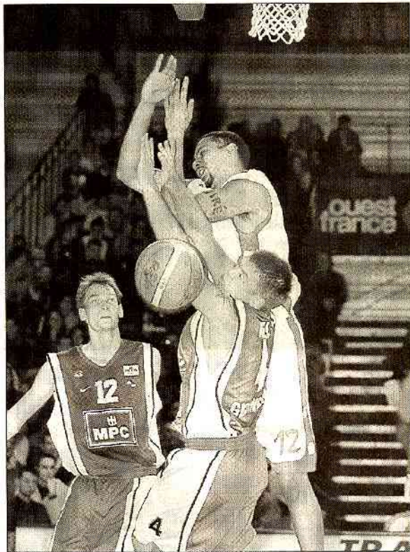
Même s'ils se sont fait des frayeurs, Akpomedah et Cholet-Basket ont su assurer leur succès.

Pour son retour à la Meilleraie en coupe d'Europe, Cholet-Basket a alterné l'excellent et l'inquiétant. Mais les joueurs des Mauges ont assuré l'essentiel face à une vaillante équipe de Gröningen.