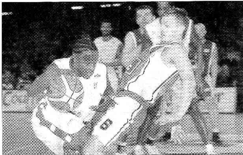
Au même titre que Maroussi ou Anagnostidis (pour deux retours pour le All-Star Game), un autre Ball avait joué récemment dans les playoffs de CB. Le joueur UE, à côté de Siba, poursuit actuellement sa construction de retour de l'équipe des Mauges.

● Les résultats de mardi, Cholet - Groningen, 84-57; Gran Canaria - Maroussi Athènes, 78-75; Zadar - Dantania, 81-64.