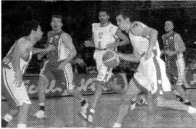
Genler et Akpomedah se sont fait des frayeurs hier soir. Après avoir dominé la rencontre, de la fin et des équipes, l'entraîneur des Maugeais a été déjoué par Gröninge dans la rencontre, avant de renouer la situation, via Ball dans le dernier quart.

CHOLET - GRÖNINGEN : 79-87 (34-14, 11-17, 14-20, 20-16). Arbitres : M.M. Pimentel (Por), Perez Paraz (Esp) et Garcia Gonzalez (Esp). 3.497 spectateurs.