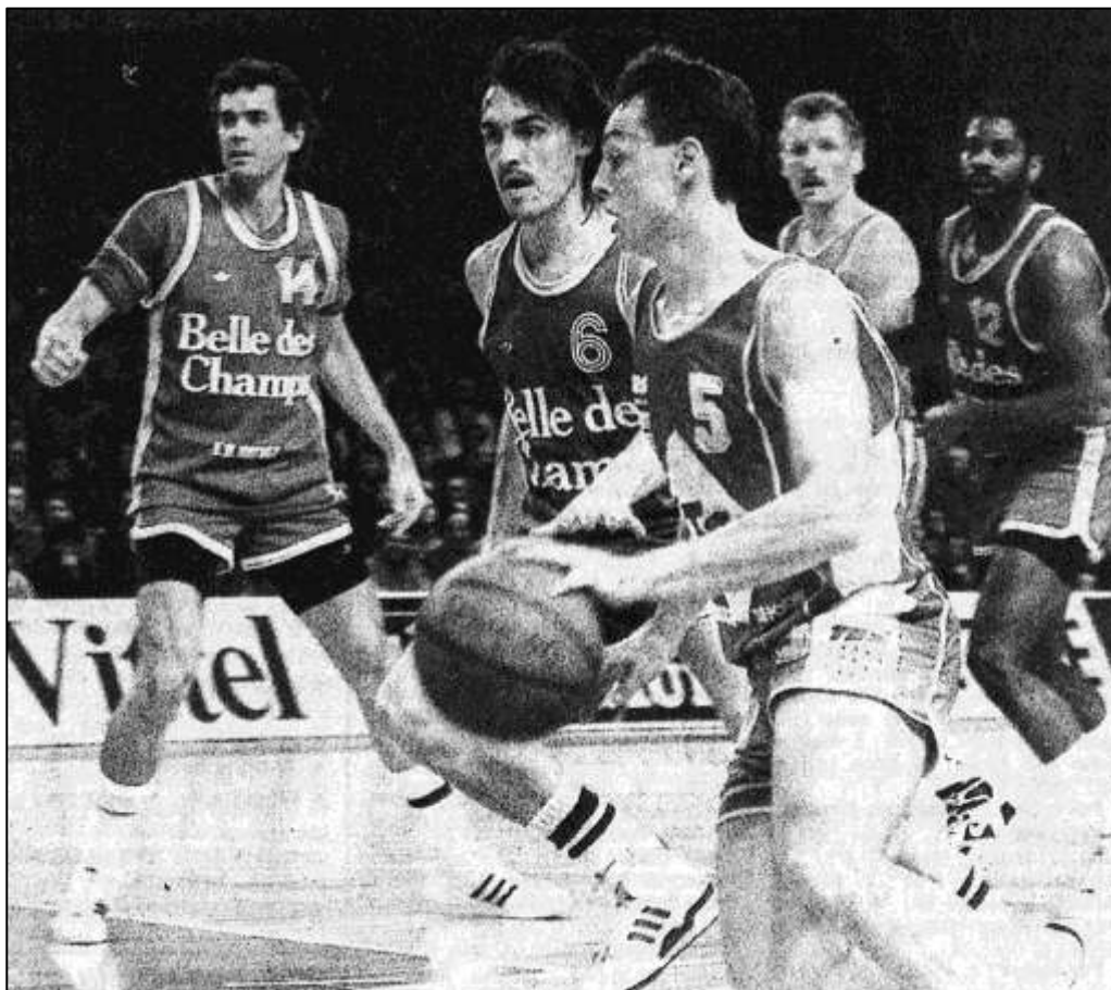
Ortega a tenu plus longtemps qu'Hufnagel la bride à Demory. Le n° 6 orthézien a fini par s'avouer vaincu. Le meneur choletais était irrésistible samedi