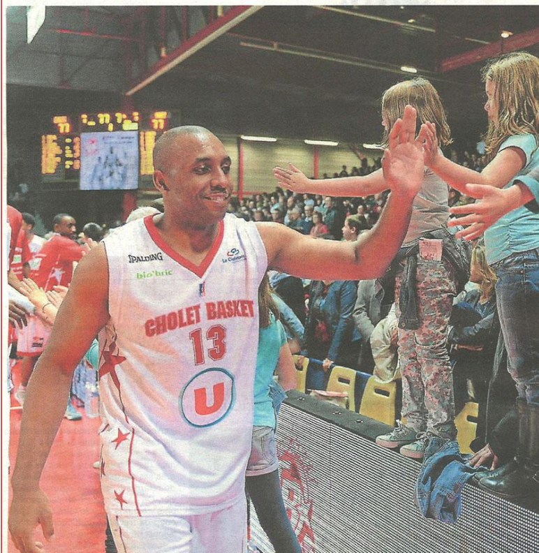
Cholet a mis un terme à sa saison à domicile en disposant de Nancy.