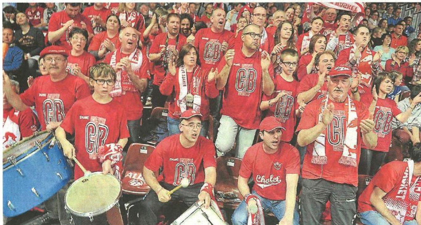
Cholet, 26 avril. Les C'Bulls, un groupe de supporters à fond derrière leur équipe.

Le groupe de supporters les C'Bulls et la fanfare animent les rencontres de Cholet Basket. Chez eux, malgré une saison sportive décevante, la passion du basket et de la musique n'a jamais fait défaut.