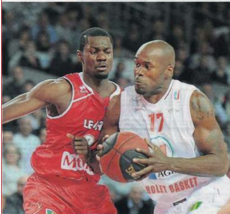
Au complet pour la première fois de la saison, Cholet s'est montré très compétitif face au Havre. page 4