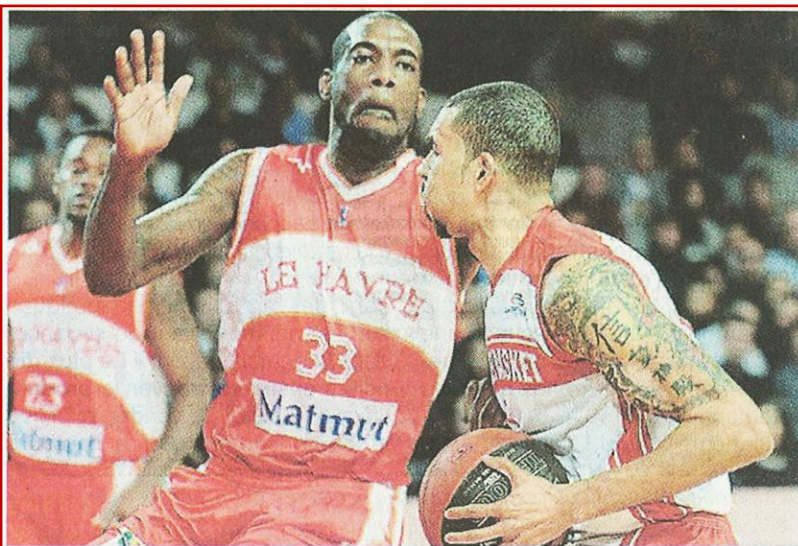
Pour Cholet, cela va de mal en pis. Cholet Basket a concédé sa 5 e défaite consécutive samedi soir en perdant contre Le Havre 79 à 84. Encore une désillusion pour les supporters choletais qui néanmoins ne se sont pas montrés véhéments.