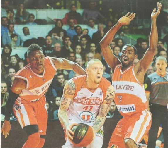
Face au Havre, Cholet a concédé sa 5 e défaite de suite. Sans jamais sembler en mesure de réagir. page 8