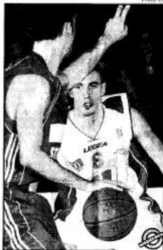
De Colo a de nouveau signé une très grosse perf