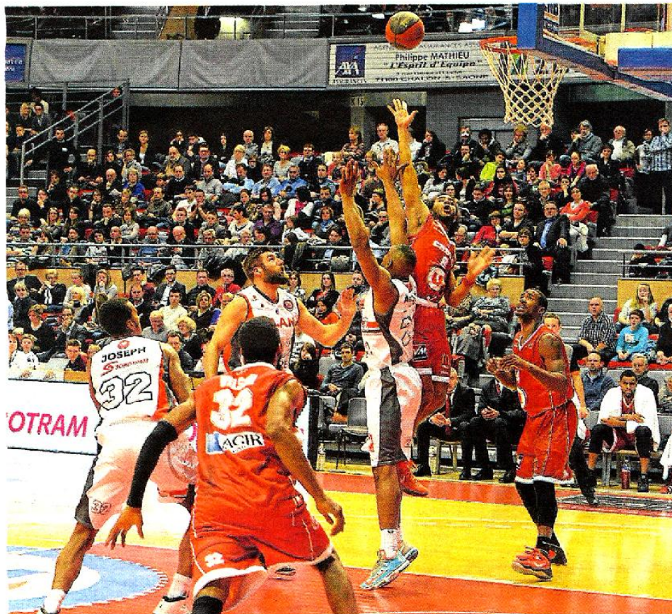
Sur le parquet de Chalon, Cholet a concédé sa troisième défaite de rang en championnat.