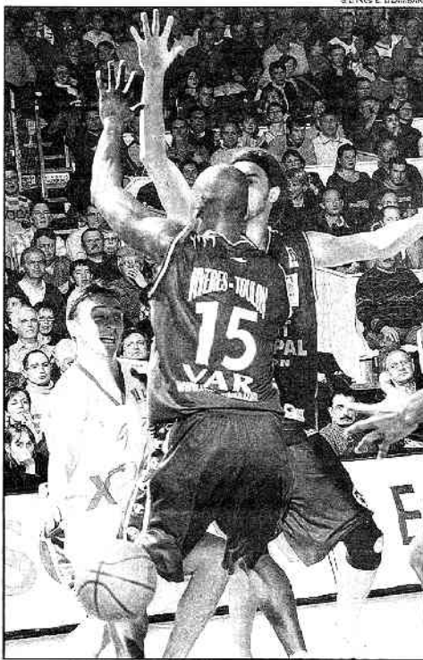
Si Ferchaud et CB parvenaient à franchir l'obstacle varois, ils auraient fait le plus difficile dans la course à la quatrième place

L'adresse du HTV, sa capacité à perturber l'adversaire par ses