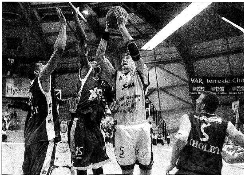
L'attaquant s'est vraiment égaré à l'heure, l'ancien choletais, et Akpomadah, Gotschalis et Pocher, à moins la main sur la nouvelle en 20 minutes.

• Les espoirs choletais n'ont subi une nuit de défaite hier dans la Var (78-67).