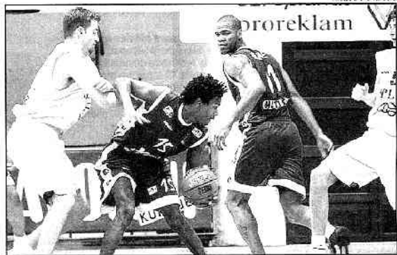
Gelabale, Marquis et les Choletais ont touché le fond à Split

Remonté comme jamais après le match, il pensa d'abord « punir » ses joueurs en organisant un entraînement hier à 17 heures, soit dès leur retour à Cholet. Après réflexion, il a finalement opté pour une réunion « disciplinaire » au cours de laquelle il a exposé le « règlement interne » qu'il