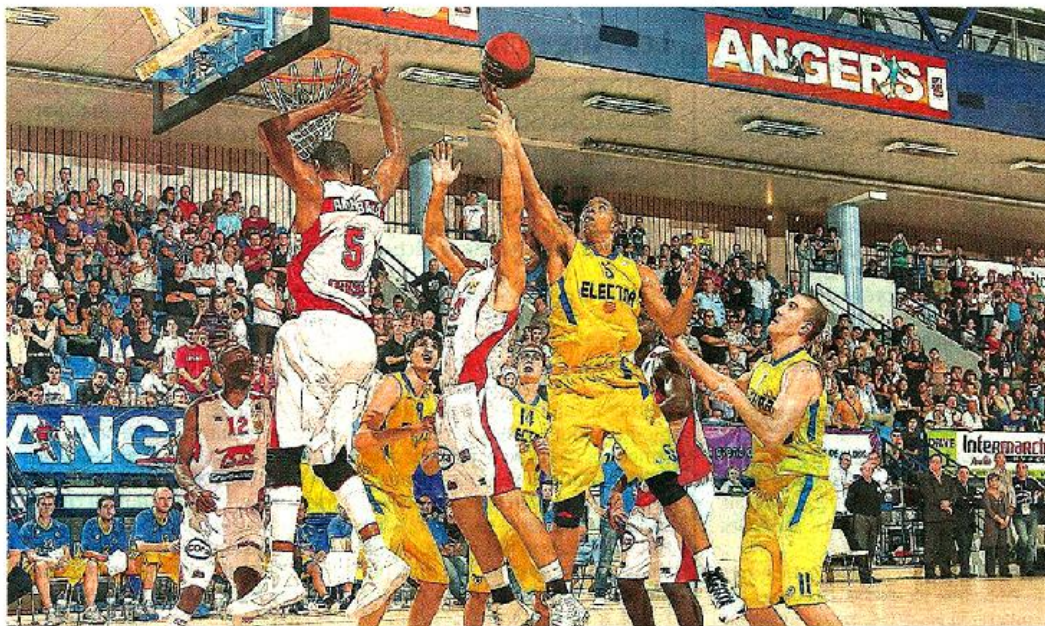
Angers, salle Jean-Bouin, hier soir. Comme en 2009, le Maccabi Tel-Aviv - ici en jaune - a fait main basse sur le Pro Stars, en disposant cette fois-ci du champion de France Nancy au terme d'un match sans suspense.