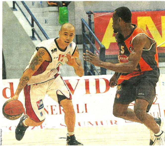
Vainqueurs du Mans (76-66), Cholet finit 5 e du tournoi Pro Stars, sans se rassurer. page 10

Ouest France – Dimanche 25 septembre 2011