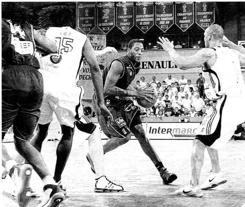
Menés à la pause, Robinson et les Choletais sont parvenus à s'imposer dans la douleur, à Limoges.

Le changement de décor fut radical dans le deuxième acte. En laissant Limoges installer son jeu rapide, la défense choletaise exposa dangereusement les intérêts du leader de Pro A. Hite, en particulier, paraissait inarrêtable. Pire : à l'autre bout du parquet, CB ne parvenait pas à se ménager des positions ouvertes pour compenser ses largesses défensives. Avec un pitoyable 3/20 aux tirs en 10