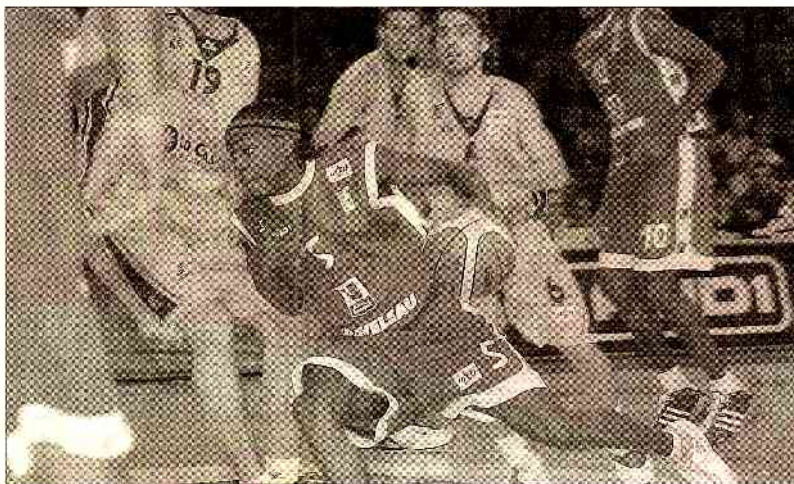
Un tir de la Grèce lors de la comparaison hier face à des Grecs concourant à l'obtention d'une qualification pour les Jeux olympiques. Dominée dans les deux premiers quarts, la formation des Mages doit maintenant se reconstruire, à domicile pour conserver l'espoir d'obtenir un succès futur.