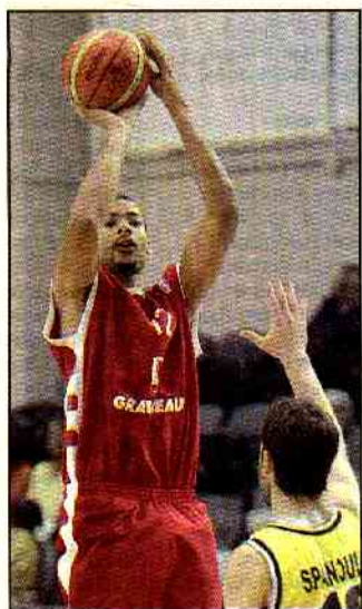
Akpomedah et les Choletais n'ont pas eu leur efficacité habituelle