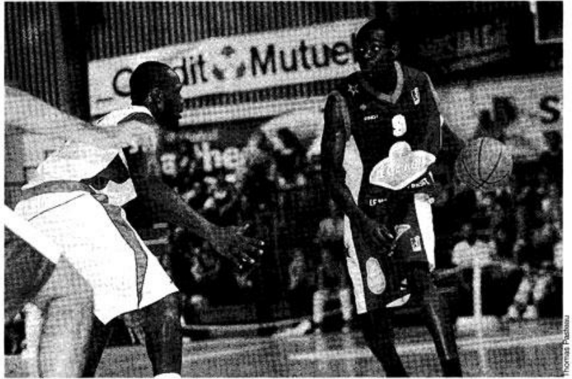
Le Mans s'est imposé face à une formation sarthoise qui n'aura tenu qu'une mi-temps.

Un peu plus tôt dans la soirée, Nancy avait décroché son billet pour la finale en s'imposant avec panache devant une équipe de Cholet sans relief. Les hommes d'Herman Kunter n'auront fait illusion que l'espace d'un quart-temps avant de s'écrouler sous les coups de butoir d'Amagou et consort. Menée de 11 points à la pause (42-31, 20'), la formation choletaise, en panne de vitesse et en manque d'inspiration, subissait la loi d'une équipe de Nancy très en verve. Les joueurs de Jean-Luc Monschau s'imposaient au final sur le score sans appel de 90 à 71.