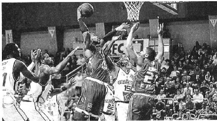
Les Choletais ont raté le coche à Orléans, et devront retrouver le chemin de la victoire à la Meilleraie cette semaine.