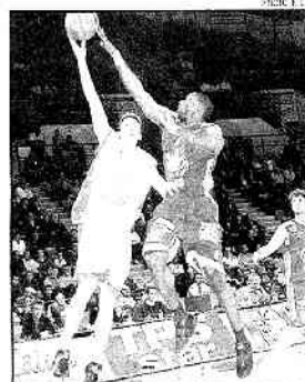
Les Choletais ont remporté douze de leurs quatorze derniers matchs

Depuis l'ouverture du championnat, le 6 octobre dernier, les Choletais ont incontestablement gagné en constance et en maturité. « Mon