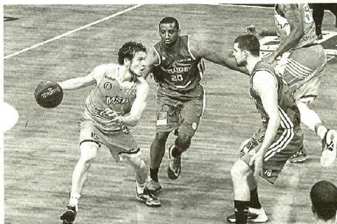
Vainqueurs au Mans, Moerman et les Limougeaudois prennent le fauteuil de leader.

Antibes - Chalons ..... 80-103 (14-30, 22-23, 18-27, 26-23) ANTIBES : De Jong (9), Blus (15), Solomon (9), Fein (13), Martin (5), Desroses (0), Ona Embo (5),