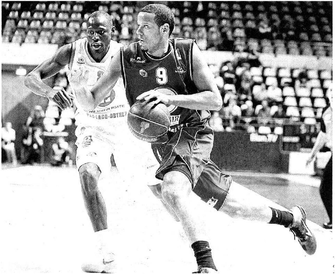
La semaine des As est déjà terminée pour Meija et Cholet.