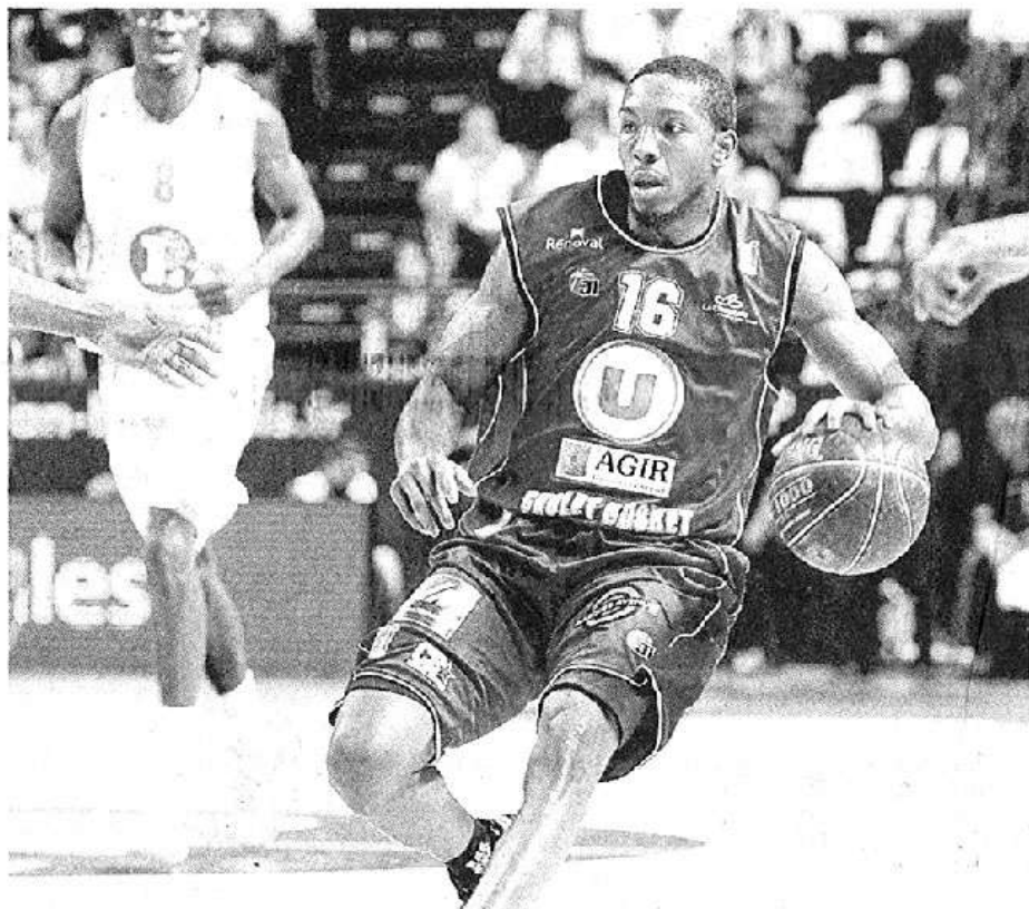
Les treize points de Nelson n'ont pas suffi...

Le programme . Aujourd'hui : 18 h, Chalon - Hyères-Toulon ; 20 h 30,