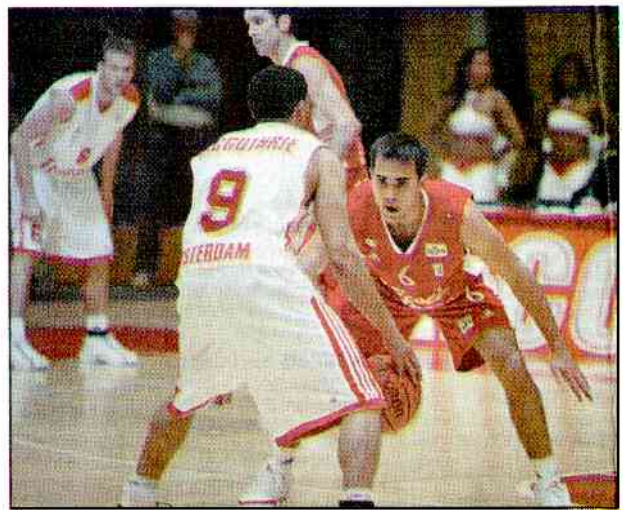
Jeanneau a tenté, en vain, de redonner du rythme à une machine choletaise grippée