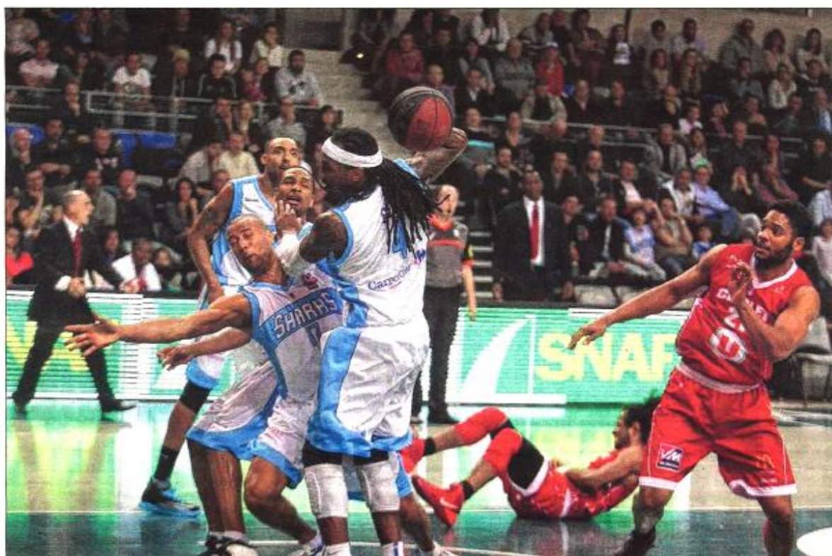
Les Antibois se sont pris les pieds dans le tapis hier soir à l'AzurArena.

Totalement dévorés dans l'engagement par une belle équipe de Cholet, Antibes a sombré hier soir à l'AzurArena (63-95). Un revers qui complique les choses dans la course au maintien