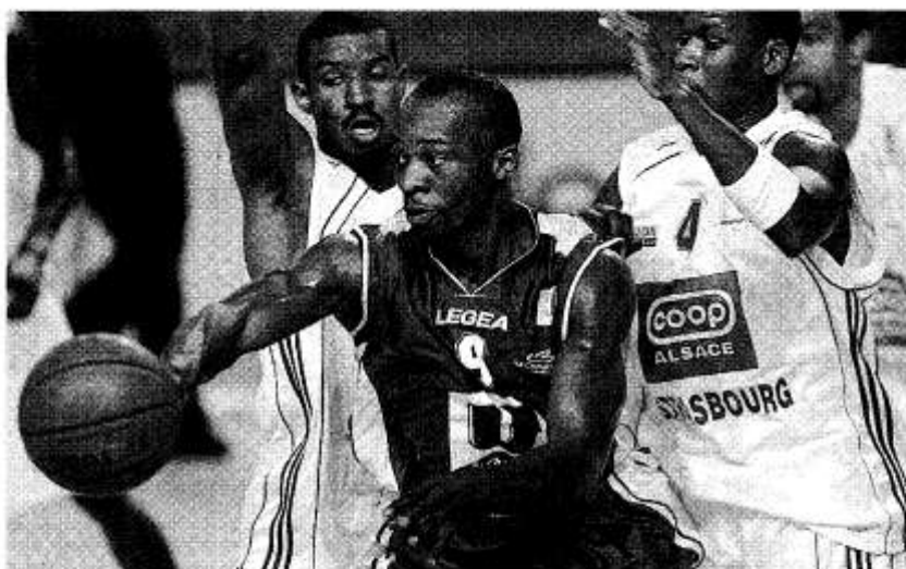
Dondon (5 pts) et les Choletais ont une nouvelle fois offert une bien pâle prestation, et restent scotchés dans les profondeurs du classement.

STRASBOURG (de notre envoyé spécial). Était-ce un miracle, ce départ canon de CB qui laissa les Strasbourgeois scotchés dans les starting-blocks (5-11, 9' puis 9-21, 13')? Assurément pas! Cholet se serait-il mis, soudainement, à défendre comme un mort de faim, sous l'impulsion de son nouveau mentor, Erman Künter? Que nenni! En réalité, la formation des Mauges montra un visage guère différent de celui affiché depuis un mois. Simplement, là où CB était laborieux, la Sig était au fond du trou. Et les Alsaciens éprouvèrent mille misères pour sortir de cette ornière et mettre fin au festival de pétards mouillés qui douchèrent le public du Rhénus Sport, bien vite contraint de siffler ses protégés. Les 3 premières possessions bas-rhinoises mirent d'ailleurs rapidement les supporters locaux au parfum: elles se soldèrent toutes pas autant de balles perdues (une balle volée par Garner dans les mains de Cooper, trois secondes de McCord et marcher de Marquis). Dans ces conditions plus que favorables, où les Strasbourgeois tendaient les bâtons pour se faire battre, Garner et Richardson (20% de réussite pour le premier à 1/5 et 0% pour le second à 0/2 à la fin du premier quart) pouvaient bien continuer à foncer bille en tête dans la défense alsacienne, oubliant de distribuer le jeu, le mal restait sans conséquence au tableau d'affichage. Gray, très présent au rebond offensif, assurant un minimum de points pour laisser CB en tête (7-13, 10').