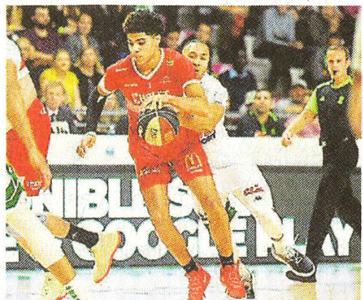
La Voix du Nord