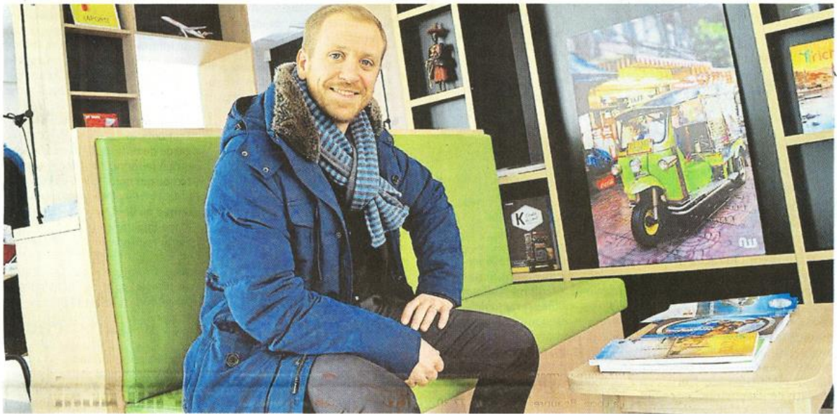
Cholet, jeudi. Dans la nouvelle agence du siège, Richou voyages s'adapte aux dernières tendances des touristes.

Les agences de voyages choletaises connaissent leur grande période de réservations pour les vacances d'été. Dans le top : les pays du Maghreb et les destinations nordiques.