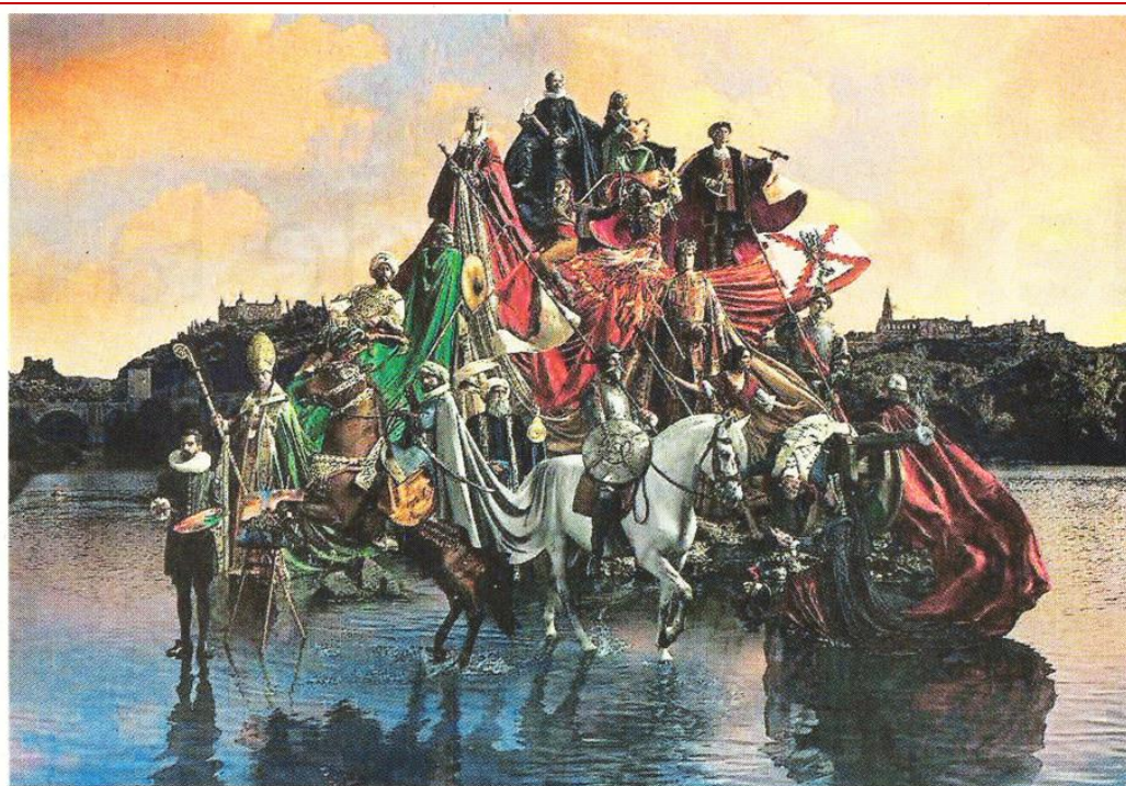
Le visuel du grand spectacle « Le songe de Tolède », avec évidemment Don Quichotte au premier plan.

Le Courrier de l'Ouest – Lundi 28 janvier 2019