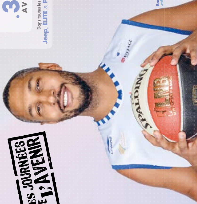
Boris Diaw Levraux

Dans toutes les salles de Jeep ELITE & PRO B