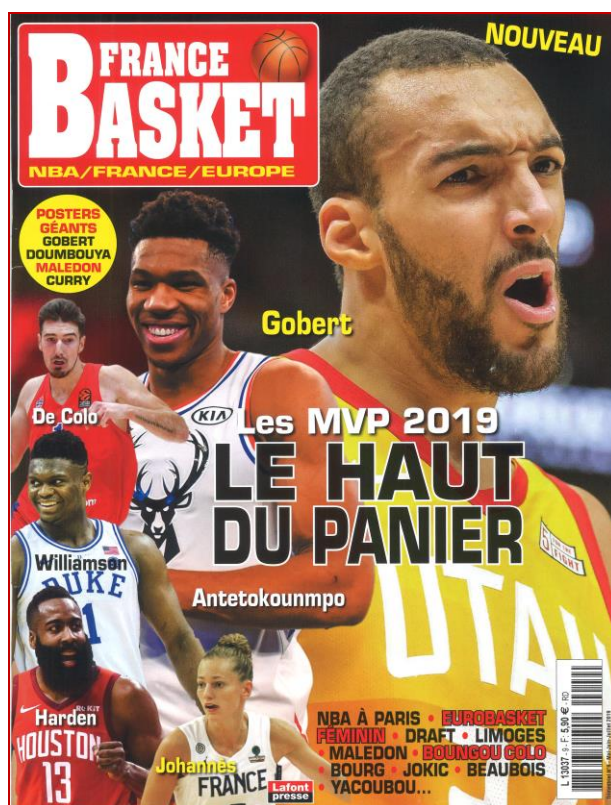
Basket France N°9 – Mai/juin/juillet 2019